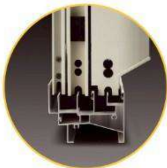
外高內低的窗框設計