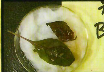
1000倍可防治粉介殼蟲