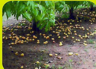
對照區之芒果大小不一，大果少要分三次採收，腐爛果多