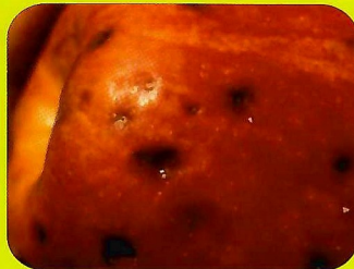
蘋果缺鈣，採收後易腐爛，鈣可增加其樹架保存期，提高其品質