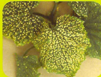
胡瓜缺鈣，葉片老化，生長遲緩