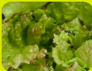
高苣之葉緣缺鈣造成焦枯