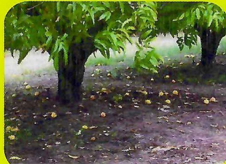
芒果葉面噴施「補鈣鎂」0.4公升/分地4次，灌注「碩寶」0.25公升/分地4次，果實大小一致，大果多，可一次採收，腐爛果少