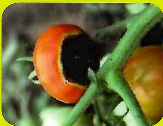
蕃茄也因為鈣之移動太慢，造成果實尖端生長點壞死，發生尻腐病