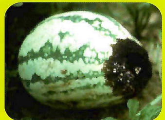
土壤太乾或太溼造成鈣之移動緩慢西瓜生長點死亡，瓜果尖端壞死