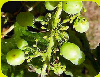
葡萄缺鈣、鎂、硼受粉，著果不佳