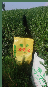
梅山茶農多年來使用【愛綠濃】及【愛蜜果888】圖為111年度秋茶之收成